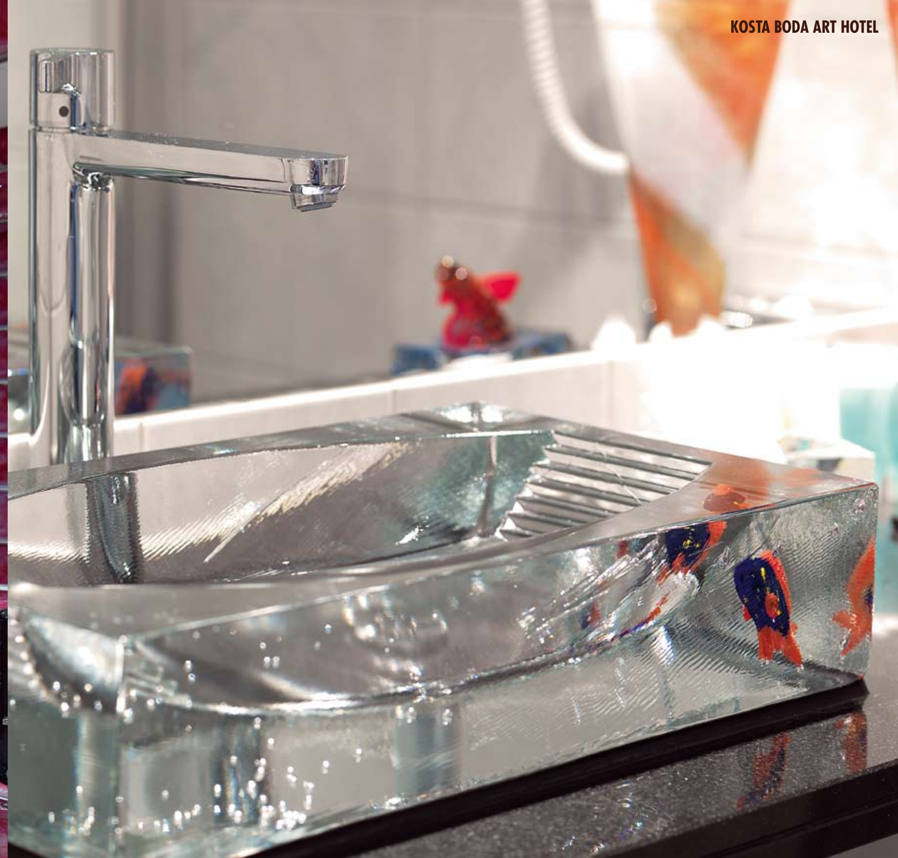
Konstnärerna har formgivit varsin flygel med hotellrum och där satt sin egen konstnärliga prägel på rummen. Handfaten i kristall finns i samtliga hotellrum och har alla fått samma form som poolen i spa-avdelningen. Blandarna kommer från Hansgrohe AB, som även har levererat de innovativa duscharna med den patenterade tekniken Raindance Air till samtliga hotellrum.