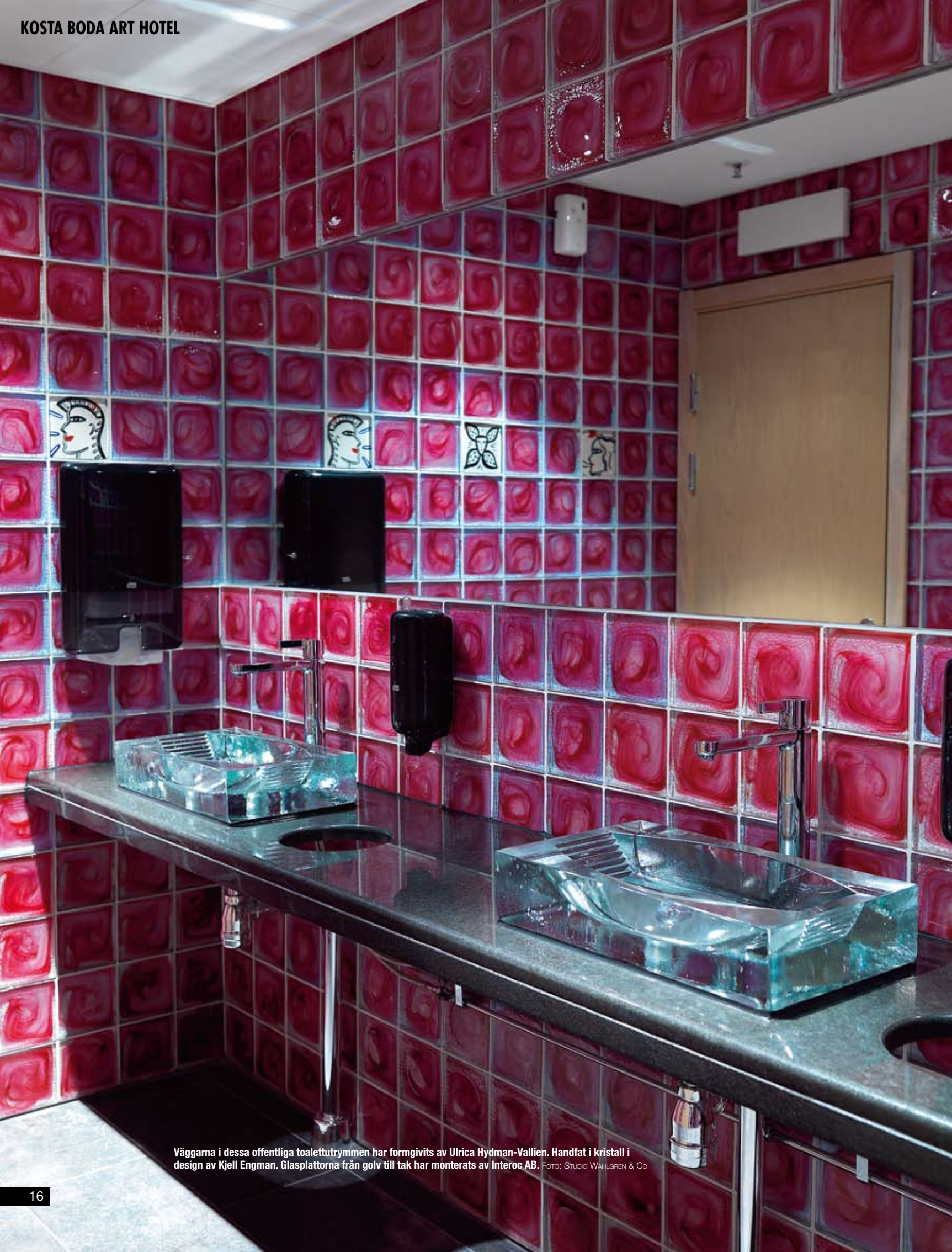
Väggarna i dessa offentliga toalettutrymmen har formgivits av Ulrica Hydman-Vallien. Handfat i kristall i design av Kjell Engman. Glasplattorna från golv till tak har monterats av Interoc AB.