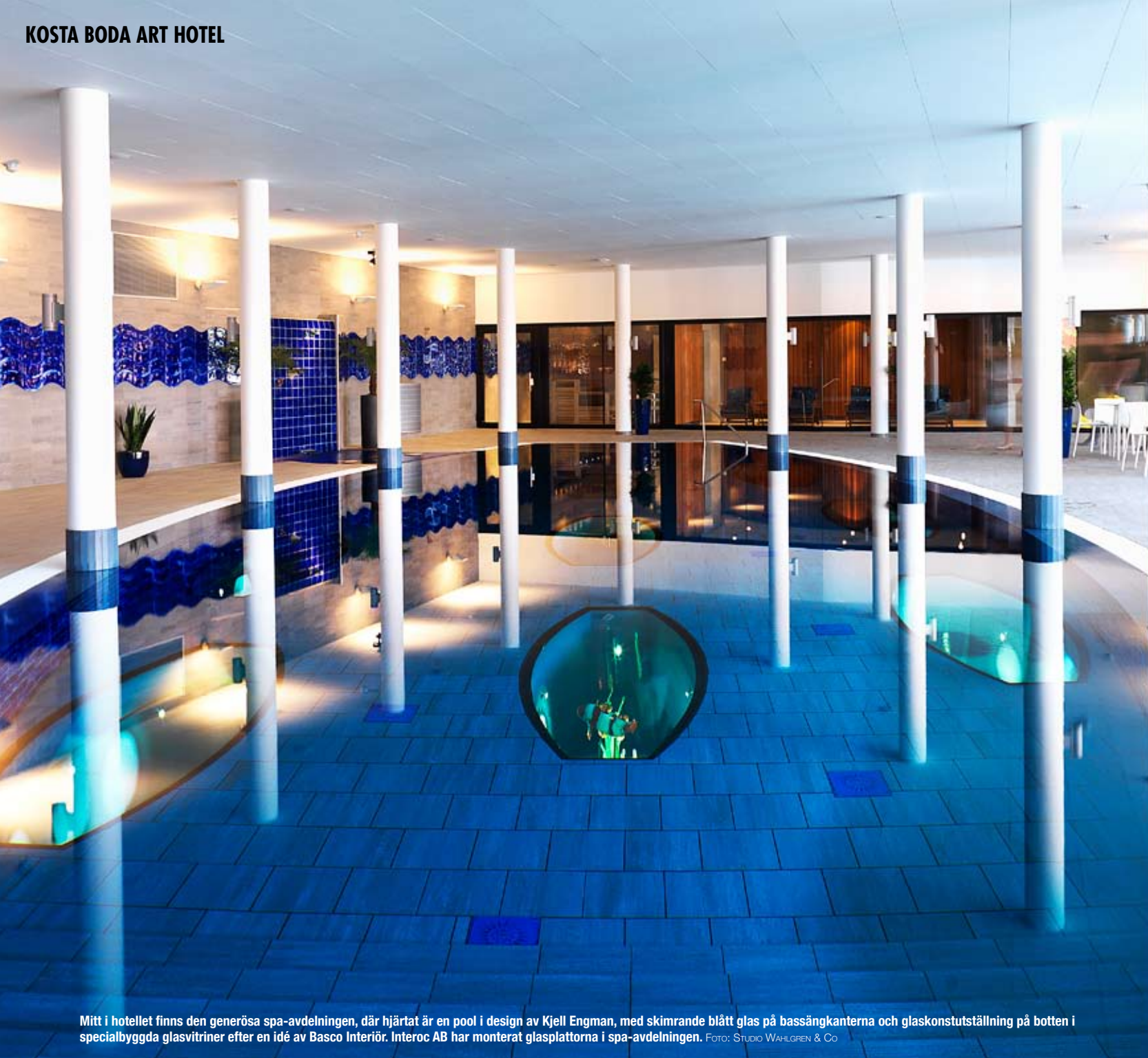
Mitt i hotellet finns den generösa spa-avdelningen, där hjärtat är en pool i design av Kjell Engman, med skimrande blått glas på bassängkanterna och glaskonstutställning på botten i specialbyggda glasvitriiner efter en idé av Basco Interiör. Interoc AB har monterat glasplattorna i spa-avdelningen.