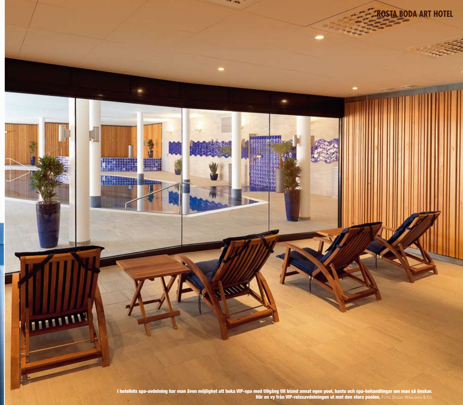
I hotellets spa-avdelning har man även möjlighet att boka VIP-spa med tillgång till bland annat egen pool, bastu och spa-behandlingar om man så önskar. Här en vy från VIP-relaxavdelningen ut mot den stora poolen.