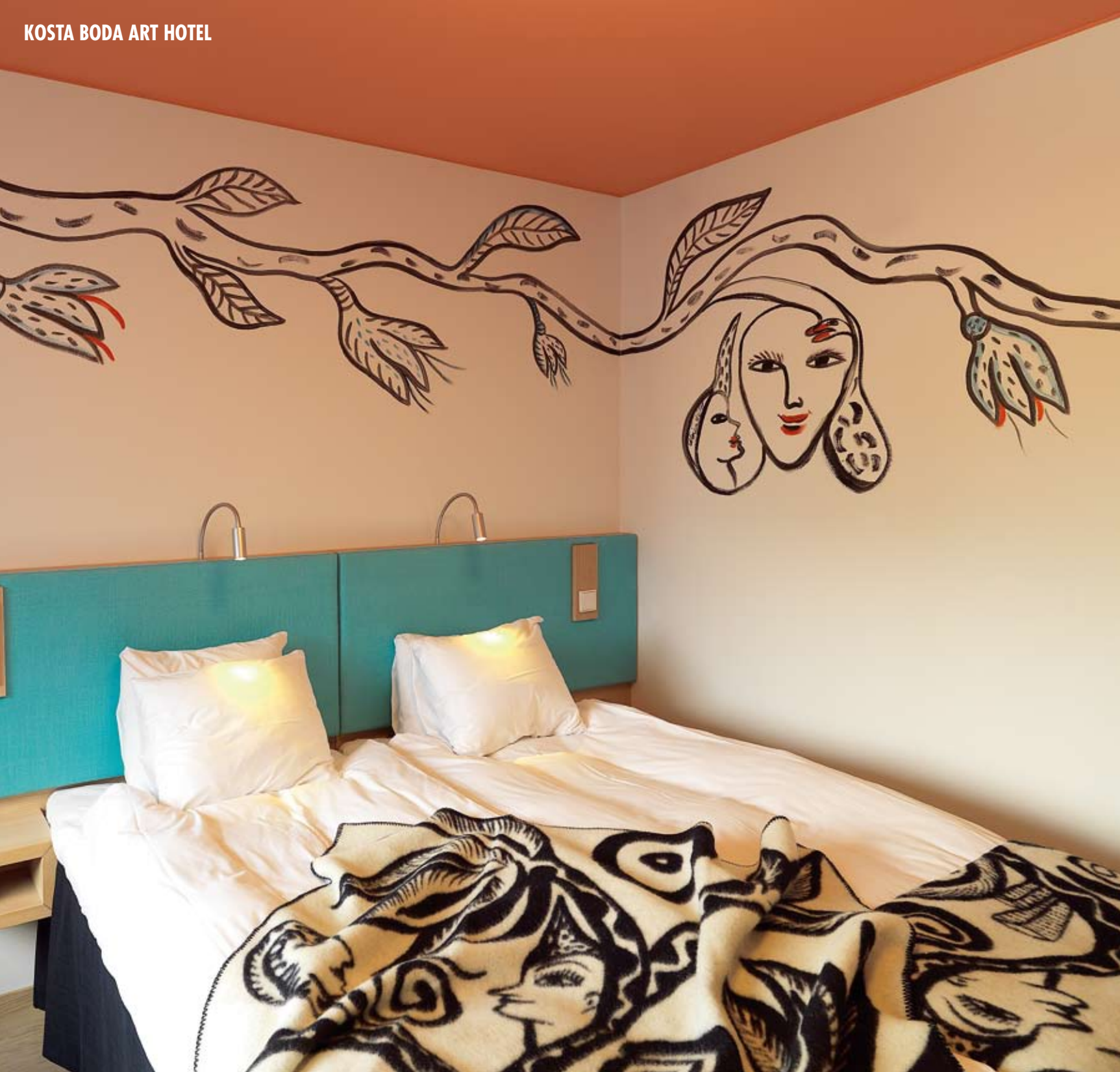
Hotellet har 102 rum och sviter där alla är utrustade med bland annat en egen espressomaskin och exklusiv minibar. Alla sängar i hotellrummen kommer från DUX. Här ett rum utsmyckat av Ulrica Hydman-Vallien.

ren men här stöpt i en unik form som präglas av olika skiftningar som både tar fart och stillnar i små detaljer genom de olika konstnärernas personligheter. Upplevelserna av hotellet blir till ett färgrikt collage där de så olika delarna ändå skapar en helhet. Installationer i form av döds skallar, en himlastege