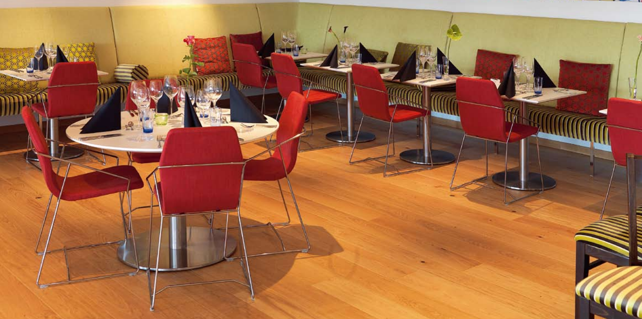
I restaurangen har man arbetat fram ett koncept för mat och dryck som bidrar till helhetsupplevelsen. Utsmyckning av Ulrica Hydman-Vallien. De röda stolarna är modellen 'Aeon', levererad av Skandiform. Stolen är nätt och bekväm i en form som ger en viss sportbils känsla med sittalet vilande i ramen, vilket skapar en följsam och behaglig sittkomfort.

ger, båda i design av Mattias Ljunggren, till hotellrummen.