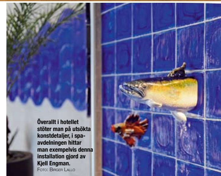
Överallt i hotellet stöter man på utsökta konstdetaljer, i spa-avdelningen hittar man exempelvis denna installation gjord av Kjell Engman.

Förutom att de sju konstnärerna har smyckat enskilda rum har de också fått göra en eller ett par stora konstinstallationer på olika platser i