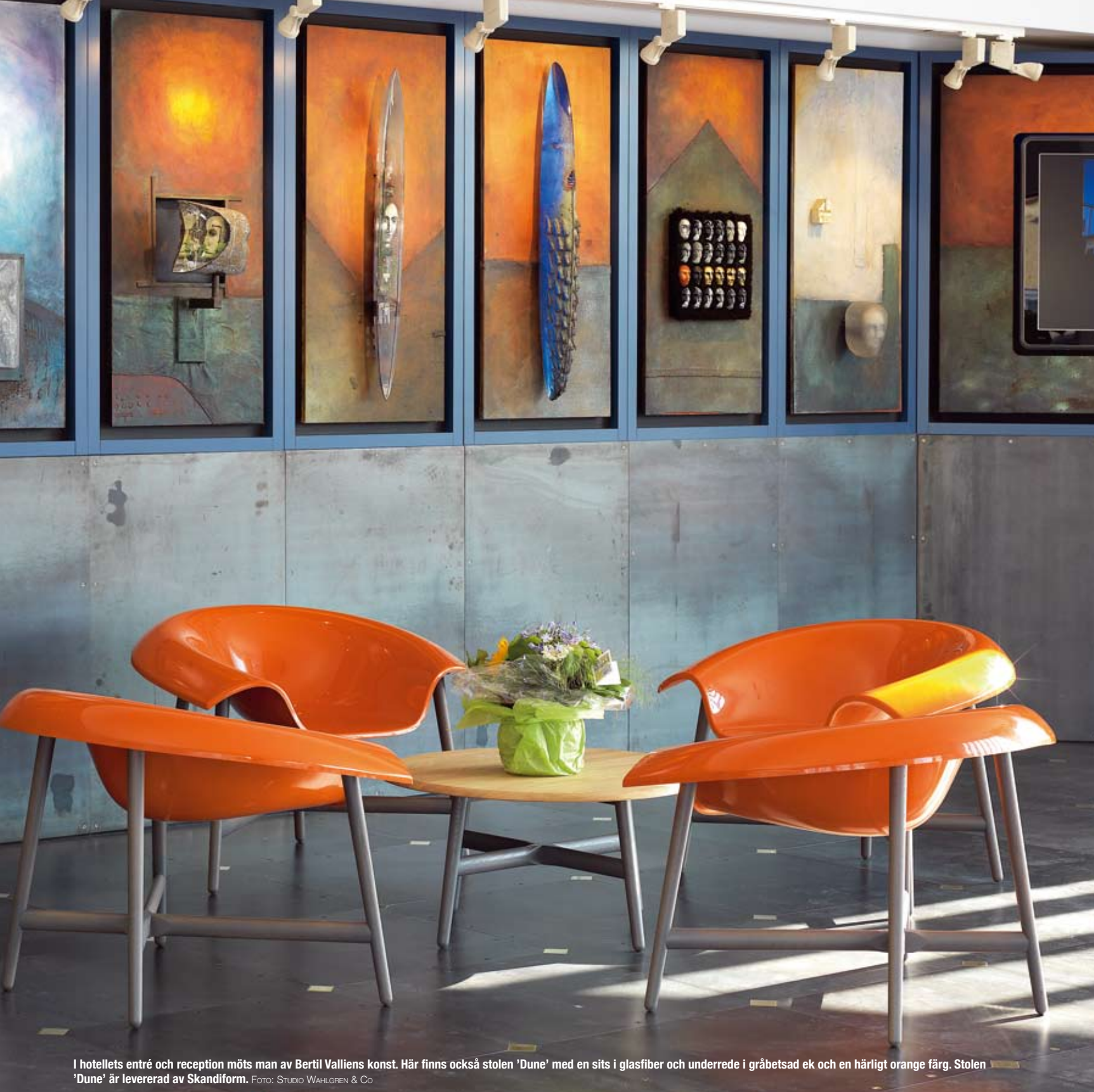
I hotellets entré och reception möts man av Bertil Valliens konst. Här finns också stolen 'Dune' med en sits i glasfiber och underrede i gråbetsad ek och en härligt orange färg. Stolen 'Dune' är levererad av Skandiform.