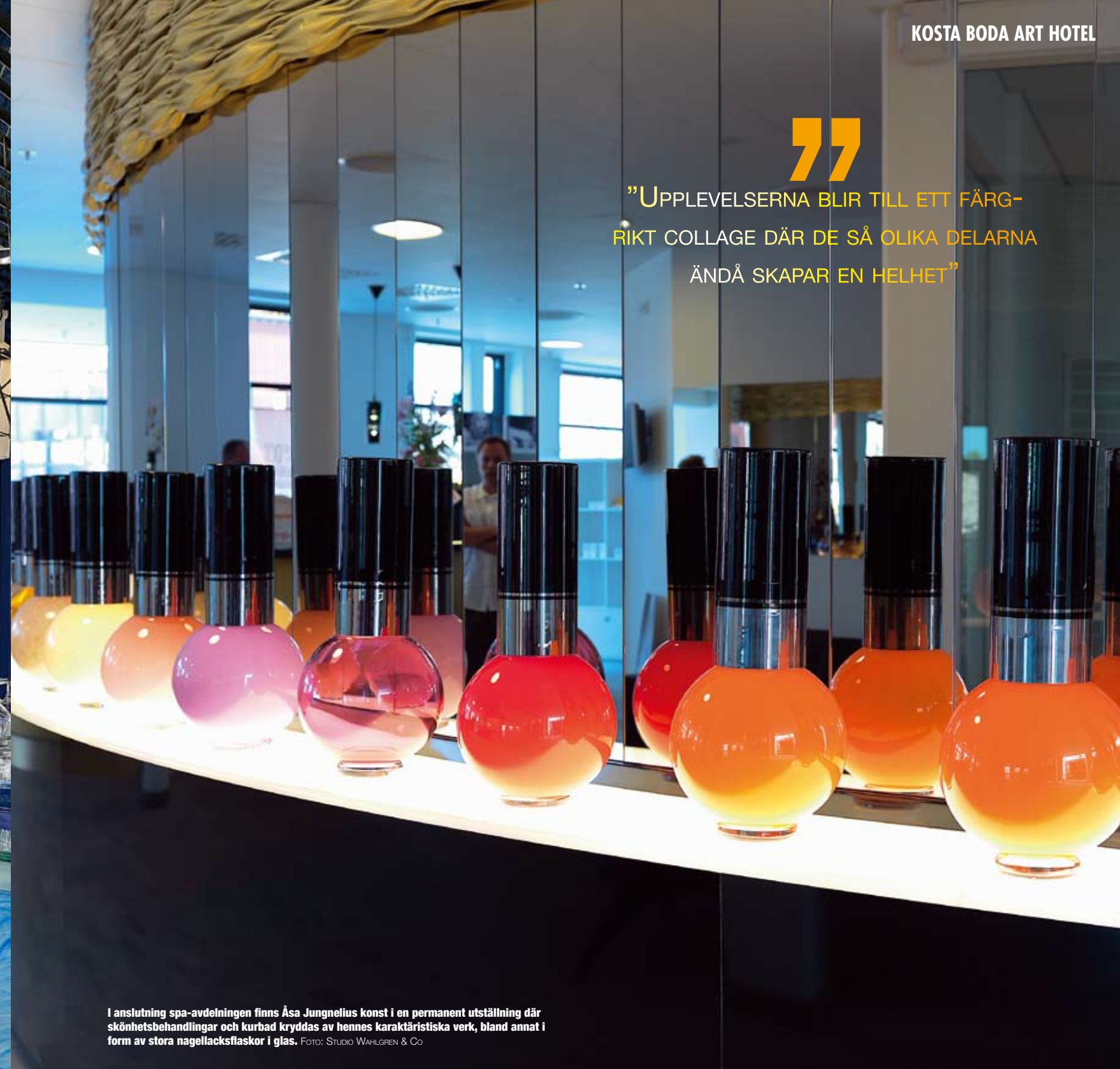
I anslutning spa-avdelningen finns Åsa Jungnelius konst i en permanent utställning där skönhetsbehandlingar och kurbad kryddas av hennes karaktäristiska verk, bland annat i form av stora nagellacksflaskor i glas.

”UPPLEVELSERNA BLIR TILL ETT FÄRGRIKT COLLAGE DÄR DE SÅ OLIKA DELARNA ÄNDÅ SKAPAR EN HELHET”