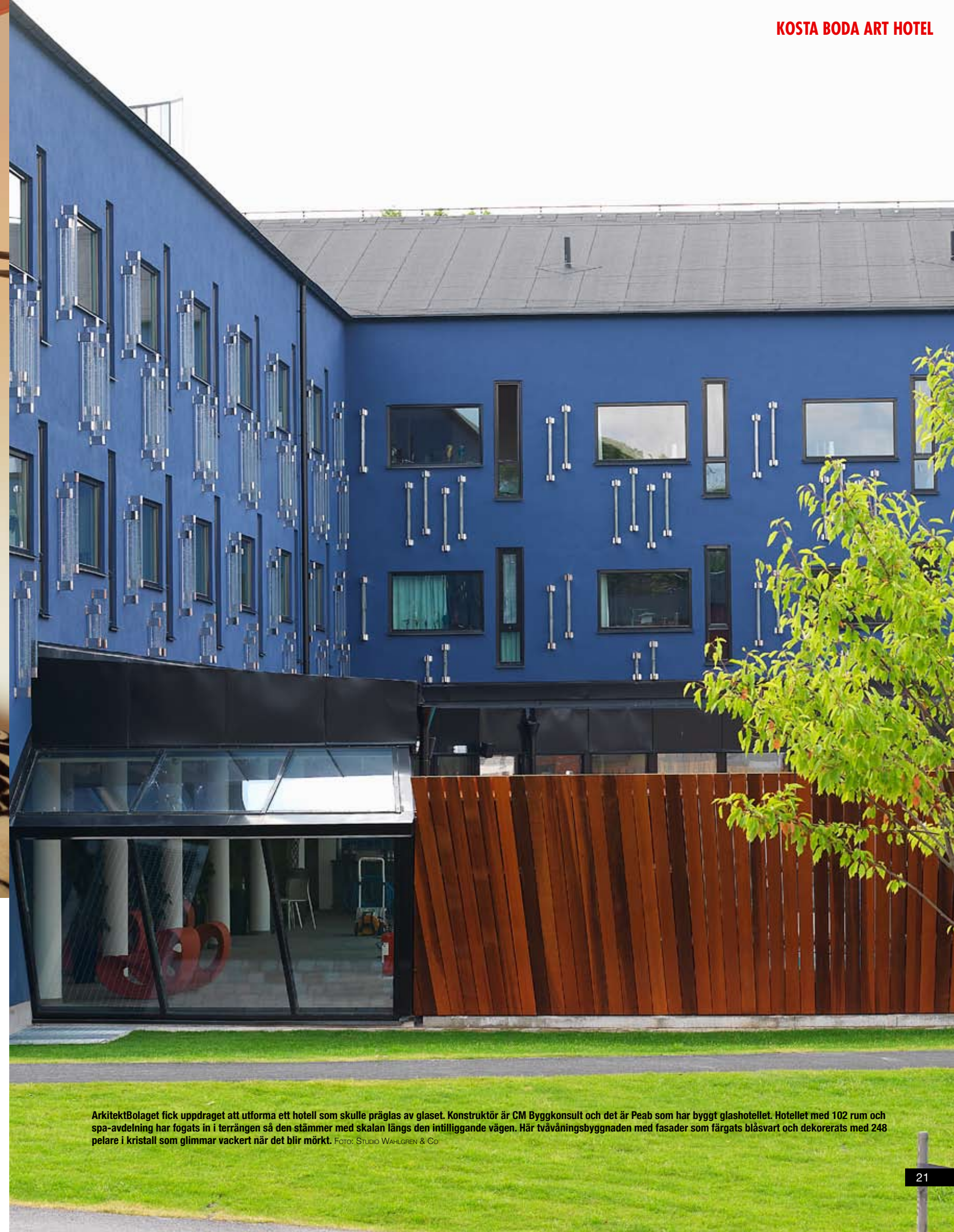
ArkitektBolaget fick uppdraget att utforma ett hotell som skulle präglas av glaset. Konstruktör är CM Byggkonsult och det är Peab som har byggt glashotellet. Hotellet med 102 rum och spa-avdelning har fogats in i terrängen så den stämmer med skalan längs den intilliggande vägen. Här tvåvåningsbyggnaden med fasader som färgats blåsvart och dekorerats med 248 pelare i kristall som glimmar vackert när det blir mörkt.

konstutställning som ett renodlat hotell, och tillsammans med ingredienser som välkomponerade restaurangmenyer, lockande spaupplevelser och bekväma hotellrum har man här helt enkelt lyckats skapa de allra bästa förutsättningarna för att uppfylla drömmen om den perfekta hotellvistelsen.