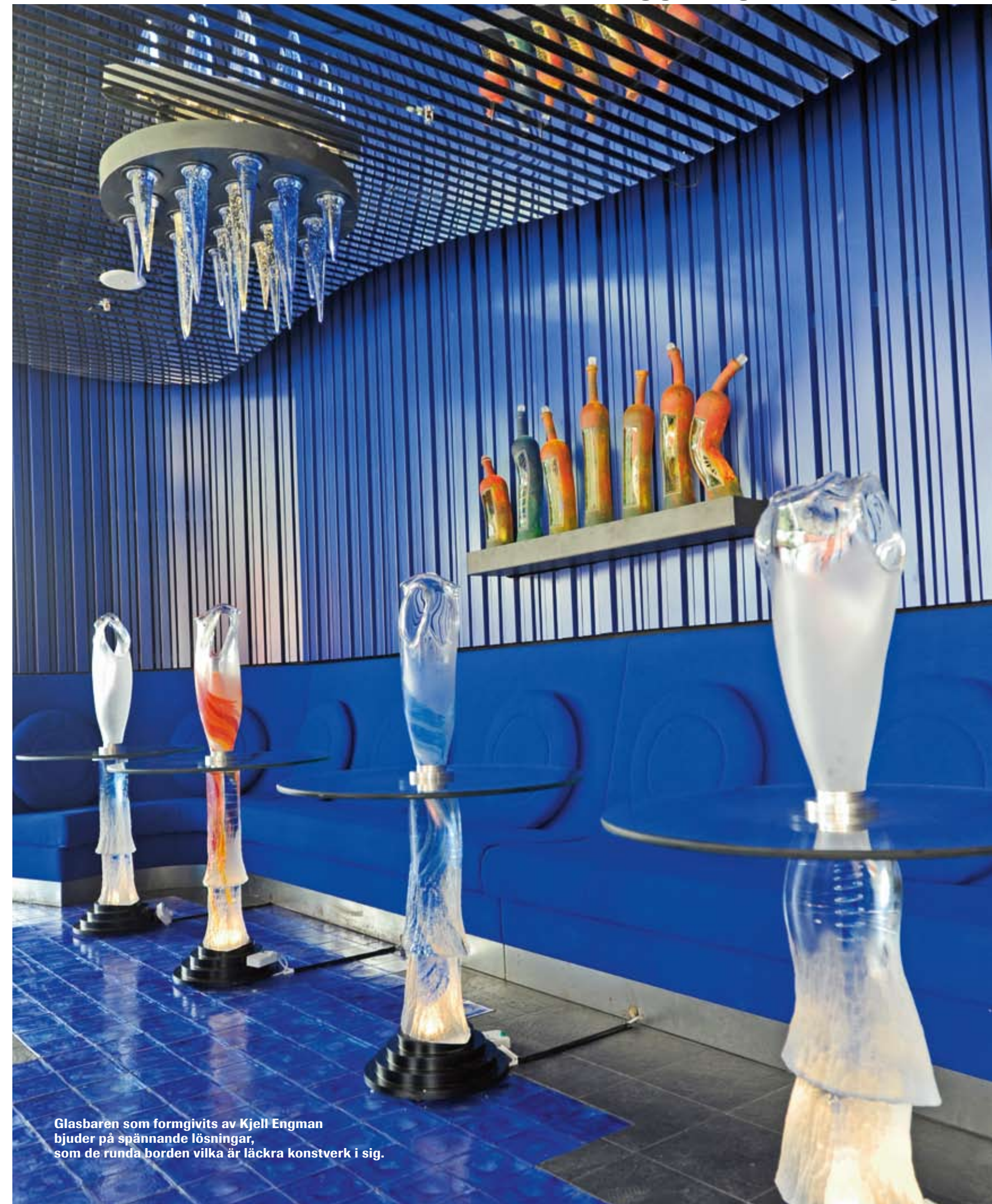
Glasbaren som formgivits av Kjell Engman bjuder på spännande lösningar, som de runda borden vilka är läckra konstverk i sig.