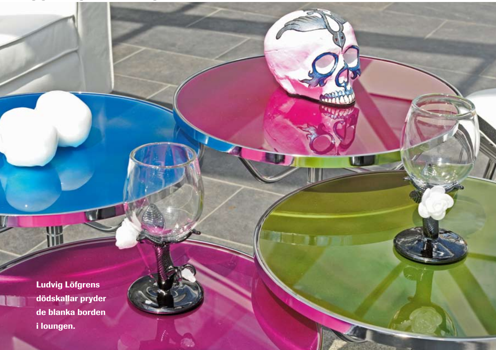
Ludvig Löfgrens dödsallar pryder de blanka borden i loungen.

I det ljusa atriét, där trappan löper mellan våningarna, har Anna Ehrner gjort en stor ljuskrona av blad som skimrar av både dagsljuset ovanför och belysning som projiceras underifrån.