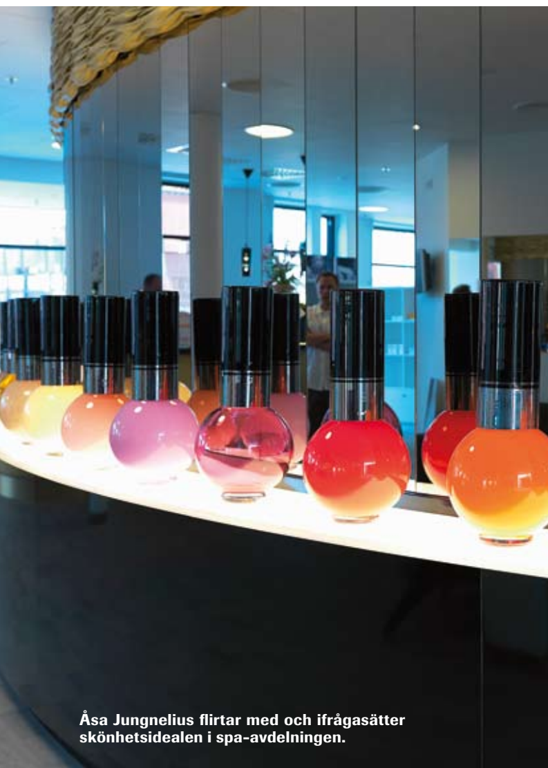
Åsa Jungnelius flirtar med och ifrågasätter skönhetsidealen i spa-avdelningen.